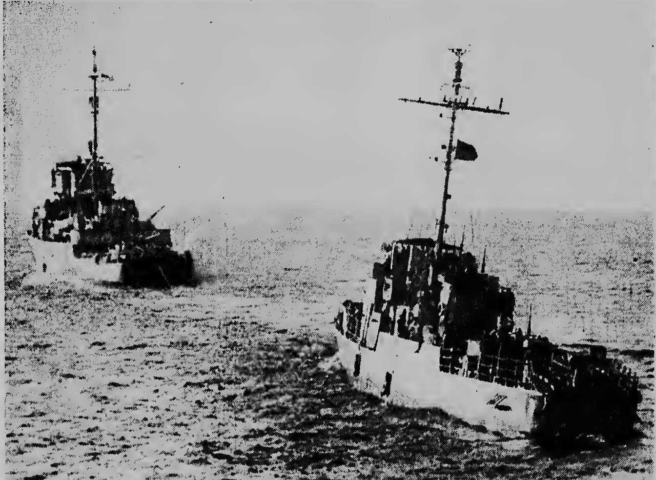
Riba e foto aki nos lectornan por mira con un bapor di patrulja di China Nacionalista (na drechi) ta worde lastra door di un barrentina hibehe Makoeng na e Islanan Pescadores, despues en ela worde torpedea na seis milja di distancia for di costa di Quemoy door di un torpedero di el China Comunista, no momento cu e bapor tabata bayendo di Formosa pa Quemoy pa e desembarca el 400 solda y 18 corresponsal estrañero. Apesar dje ataque como treinta solda y ocho corresponsal a logra luhla na terra.